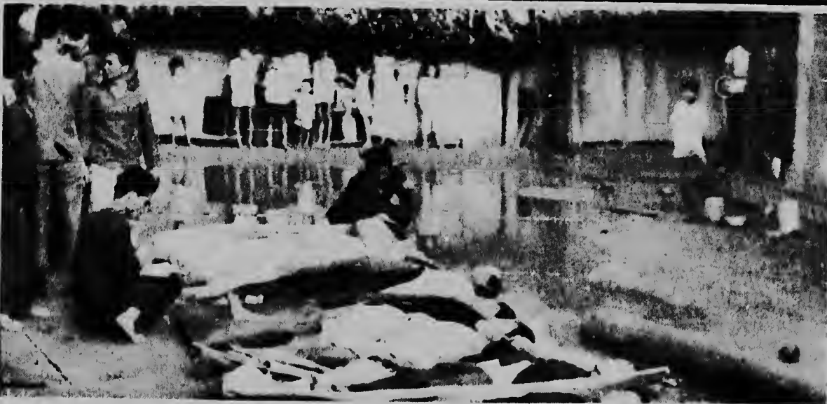
TAN HUONG, Sur Viet Nam: Un grupo di habitantenan di e pueblo Tan Huong ta para mira cadaveran di poco obrero qu tabata construi un canal, y quendenan a ser asesina den nan soño pa terroristanan Viet Cong. E trahadornan, entre cualnan tabatin hasta muher y mucha chikitu, tabata durmiendo den nan Pagoda ora qu elementonan guerrillero a ametralla nan mata.

Segun e carta e no a bisa: "Mi ta dispuesto na bai cualkier parti y reuni cu ken cu ta". E italianonan a informa cu "gobierno di Hanoi ta dispuesto na entabla negociacionnan sin pidi como condicion previa retirada di